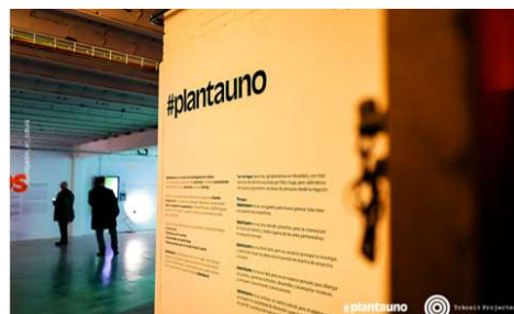
Despliegue expositivo del libro Queremos sonreír, activar la cultura local en #plantauno. Manifiesto #plantauno en el acceso al centro.