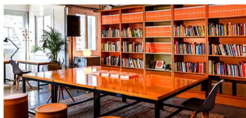
Montaje para la performance La otra pandemia de Miguel Andrés en #plantauno. Junio 2021. Despliegue de la pieza Memoria Raval de Ido diseño/ Juan David Uribe. Verano 2021. Montaje de sala para charla sobre QUEREMOS SONREÍR, activar la cultura local . Biblioteca de #plantauno

tradicionalmente. Esto se puede expresar de distintas formas: el contexto del Covid-19 ha conducido a un aumento de la actividad digital, mientras que muchas actividades culturales tienen en la presencialidad una característica básica; en este sentido, es previsible que en los próximos años se incremente la actividad de naturaleza híbrida, combinando lo presencial y lo digital. Otras expresiones de la hibridación de formatos son el desarrollo de procesos que combinen investigación, cocreación, producción y/o presentación de