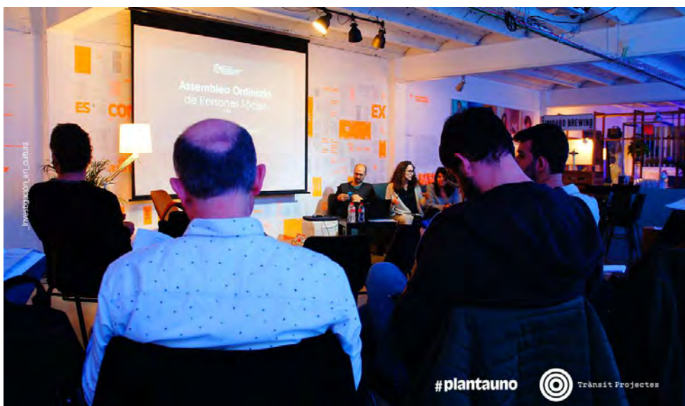
Asamblea anual de la Associació de Professionals de la Gestió Cultural de Catalunya (APGCC) en #plantauno. Marzo 2020.