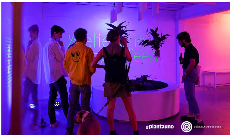
Instalación Believe in your feed , del colectivo Random Happiness dentro del proyecto #ecosistemasinterseccionales de #plantauno. Junio 2021.

Pues, como la misma descripción del espacio específica, la motivación principal de #plantauno es probar todo tipo de ideas alrededor de sus ejes de interés; e incluso poder incorporar nuevos ejes a su marco de actuación. Ese ideario de partida se resume en las siguientes líneas.