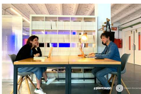
Proyecto Fes! Cultura durante su residencia en #plantauno.

productos y contenidos, y las relaciones entre los sectores con financiación pública, alternativos y comerciales) (Holden, 2015; p. 2; traducción propia). Alfons Martinell también remarca la necesidad de “transitar hacia una concepción sistémica (o ecosistémica) de la cultura (...). Entendiendo como sistema cultural un gran número de componentes o elementos que se relacionan permanentemente entre sí de forma dinámica en constante interdependencia.” (2021) Hacer énfasis en las relaciones y las interdependencias conlleva entender los espacios menos como “centros” y más como “nodos”, y explorar su capacidad de interactuar con otros agentes y actividades y de catalizar procesos junto a otros. En este sentido, #plantauno busca, más que liderar o abanderar un proyecto, ser una herramienta al servicio de otros