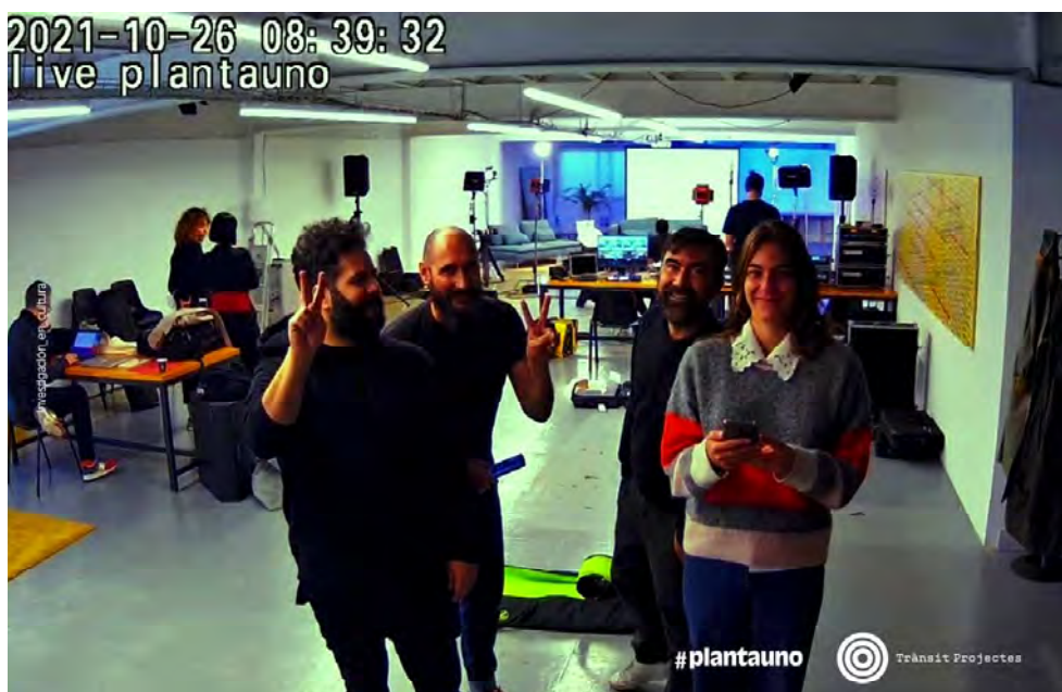
Equipo de #plantauno visto a través de la webcam que transmite la actividad del espacio 24/7 desde el dominio https://plantauno.org

versión en castellano del libro Chernóbil Herbarium (2021), que combina el trabajo de la fotógrafa Anaïs Tondeur alrededor de una colección de plantas nacidas en la Zona de Exclusión de Prípiat, y del filósofo Michael Marder, quien reflexiona a partir de estas imágenes acerca de “la pérdida de un mundo.” La presentación del libro coincidió con la instalación artística #Believeinyourfeed ( https://random-happiness.com/believe-in-your-feed/ ), del grupo de creadores y agentes de cambio Random Happiness ( https://random-happiness.com/ ), también acogida en #plantauno . Se trata de una instalación artística interactiva con plantas vivas que dependen del uso de hashtags en Twitter para sobrevivir. Cada planta se sumerge brevemente en el agua que hay debajo de ella cada vez que se usa en Twitter un hashtag concreto. De esa manera, cuanto más se use ese hashtag más posibilidades tendrá esa planta de