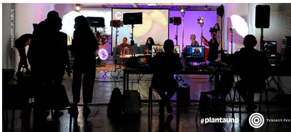
Jornadas CREA L'Hospitalet de Llobregat en #plantauno. Noviembre 2021.

de las premisas de partida del espacio, a pesar de que se descubría también que muchas otras cobraban mayor vigencia en el contexto extraordinario del presente. Así, ante las diferentes restricciones y modificaciones de actividad que se fueron sucediendo antes y después del primer confinamiento (marzo-junio 2020), #plantauno intentó seguir generando actividades puntuales, por ejemplo la participación con una dinámica poética y un taller educativo en el Berdache Gender Art Festival ( https://berdache.es/about/ ) sobre arte y género celebrado en varios espacios de L'Hospitalet, o la participación en las Jornadas CREA ( https://crea-lh.cat/ ), la fiesta del “distrito cultural” de L'Hospitalet, impulsada por el Ayuntamiento de la ciudad.