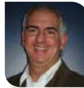
Gustavo Adolfo Restrepo (Colombia). Director General del XV Congreso Iberoamericano de Urbanismo Medellín 2012 y Director del Plan Maestro del Museo de Antioquia para la transformación del centro de Medellín.

Participante en la actividad del martes 2 de octubre “Foro Espacio Público En Acción: Sostenibilidad Creativa” y en la sesión del jueves 4 “Nuevas formas de habitar la ciudad: cultura y espacio público en acción”.