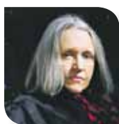
Saskia Sassen (Estados Unidos). Profesora de Sociología en la Universidad de Columbia, Estados Unidos.

Participante en el diálogo del sábado 6 “Proyectos culturales en Barcelona y Donostia-San Sebastián”.