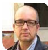
Marçal Sintès (España). Director del Centro de Cultura Contemporánea de Barcelona.

Participante en la sesión del viernes 5 “Ciudades y ciudadanías globales”.