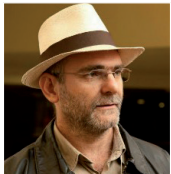
Celio Turino. Impulsor del programa Pontos de Cultura y ex secretario de Ciudadanía Cultural del Ministerio de Cultura, Brasil