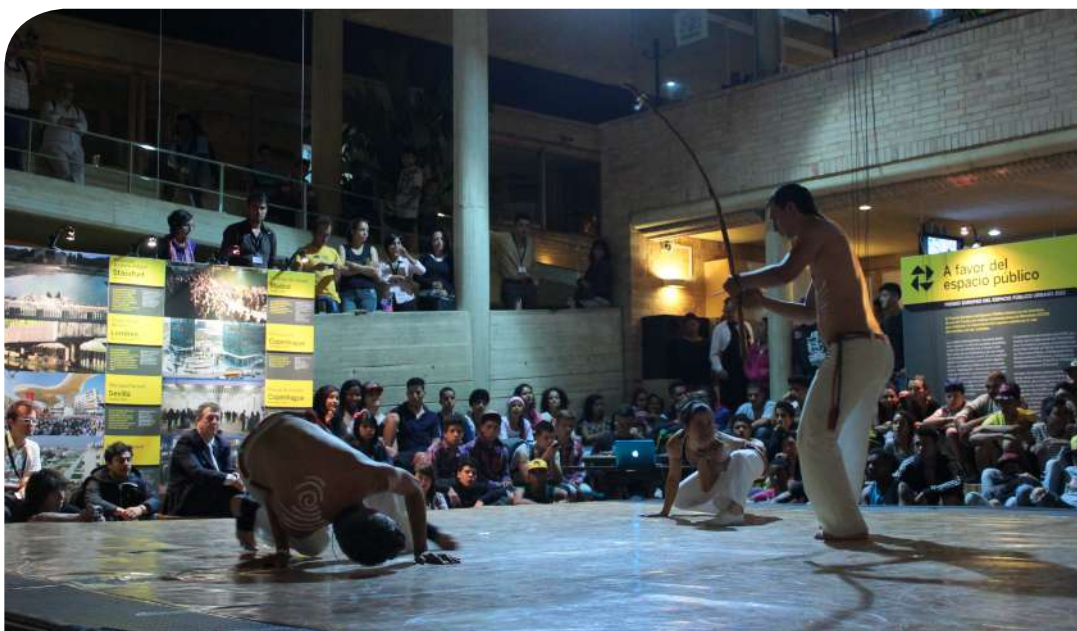
Actividad en el Centro de Desarrollo Cultural de Moravia en las Jornadas de Medellín.

La sexta es la cooperación institucional. La edición de Medellín implicó a un total de diecisiete instituciones internacionales y colombianas. En Buenos Aires, la cooperación se articuló como un proyecto compartido de la Secretaría de Hábitat e Inclusión y la