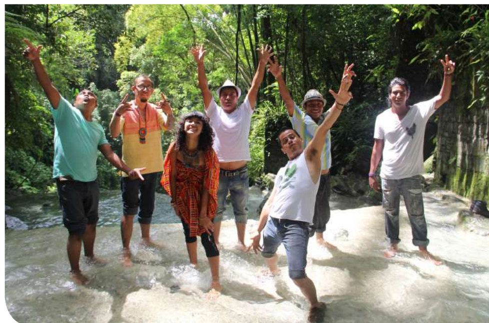
A la derecha, Noyolo, grupo musical autor de la canción de Monterrey Creativa.