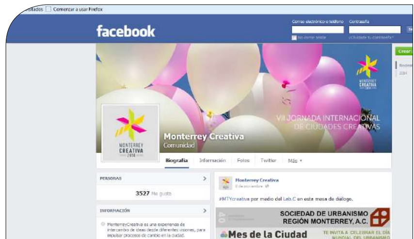
Captura de pantalla Facebook Monterrey Creativa.