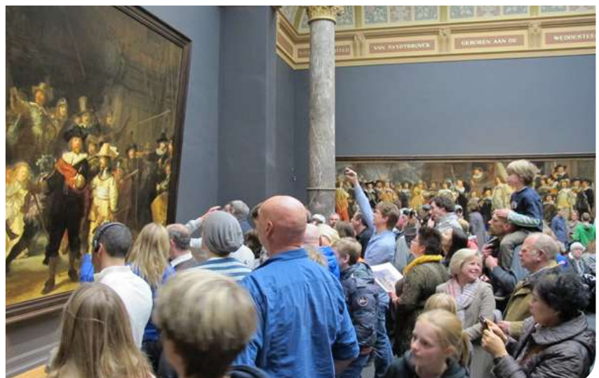
Rijksmuseum de Amsterdam.

En este cambio de época uno de los desafíos más difíciles de afrontar es el modificar nuestro pensamiento frente a la complejidad creciente, la rapidez de los cambios y lo imprevisible de los acontecimientos la educación nos puede ayudar asumir estas nuevas perspectivas no obstante será necesario reconsiderar la organización