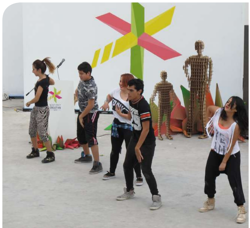
Grupo de Hip Hop de la Universidad Regiomontana participando en Monterrey Creativa.