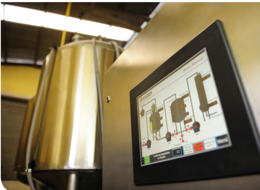
Depósito de biocombustible.