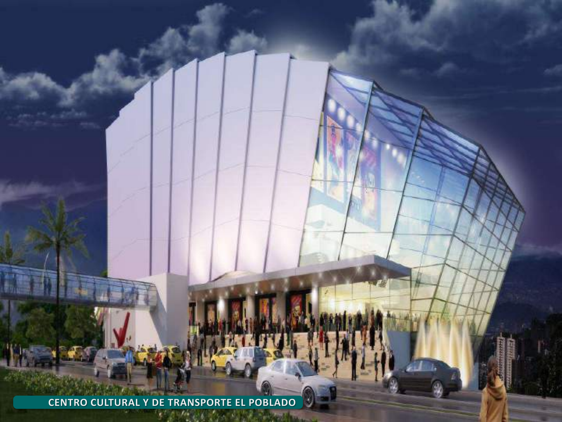
CENTRO CULTURAL Y DE TRANSPORTE EL POBLADO