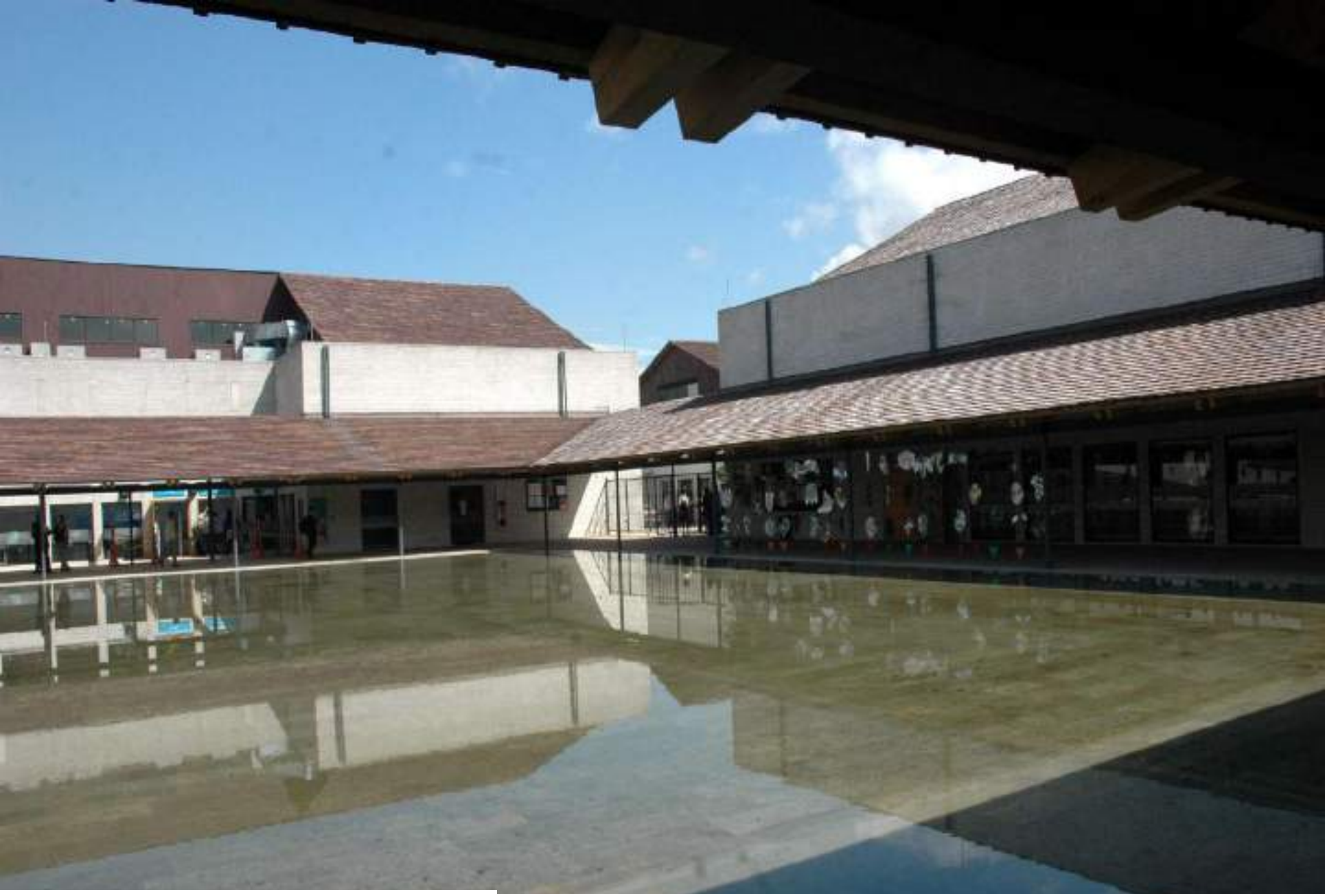
Parque Biblioteca Belén