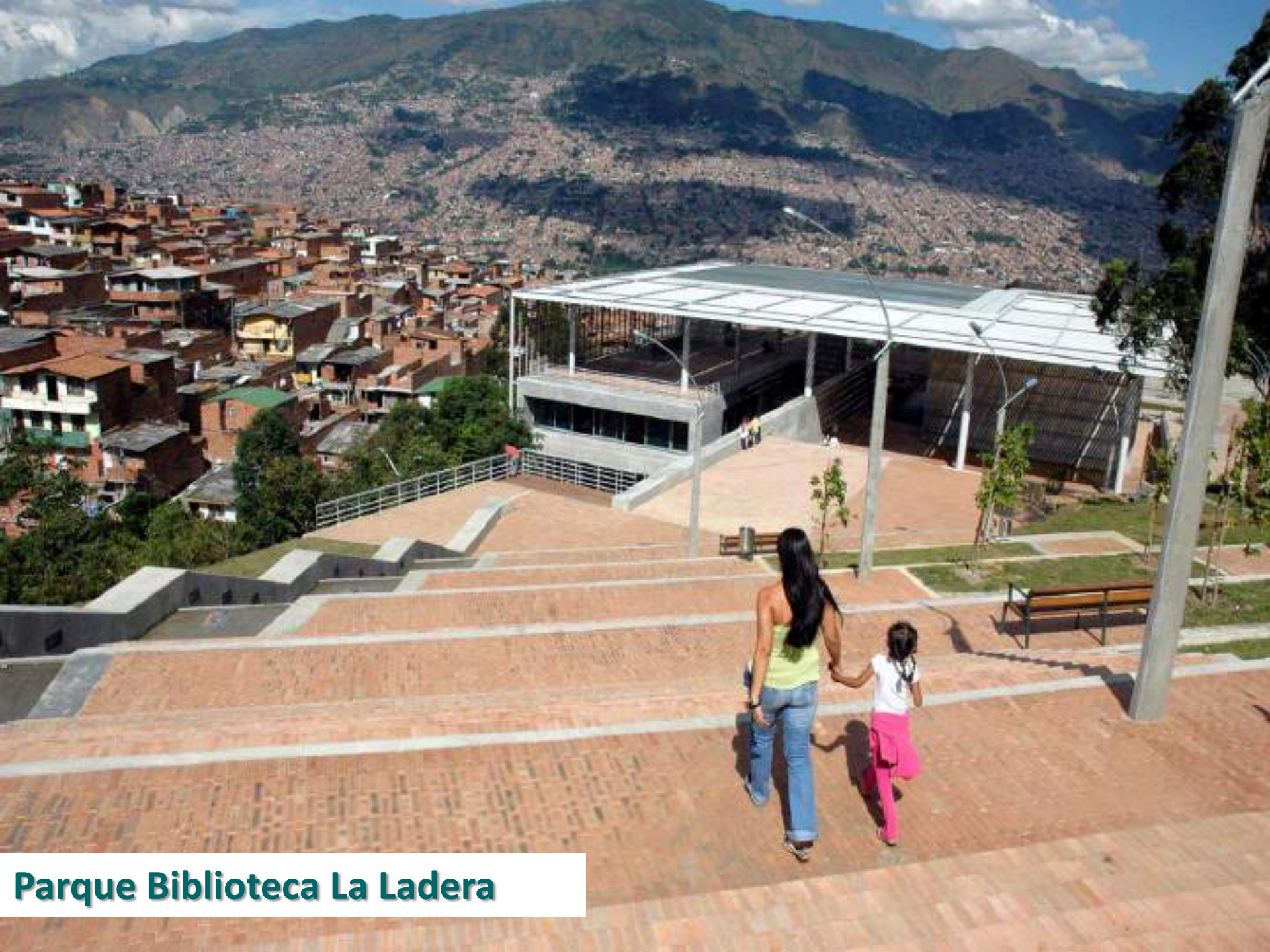
Parque Biblioteca La Ladera