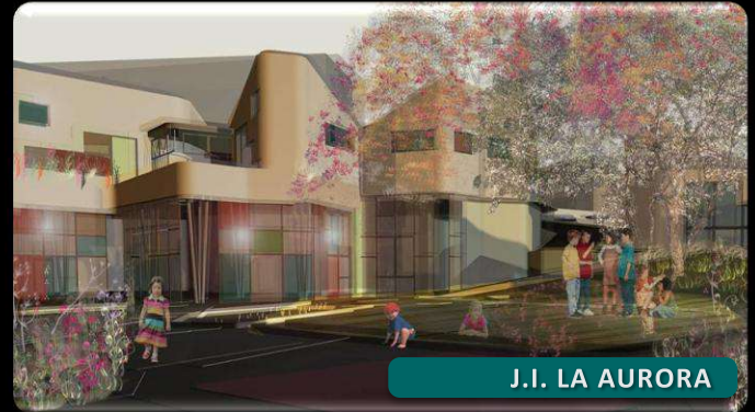
J.I. LA AURORA