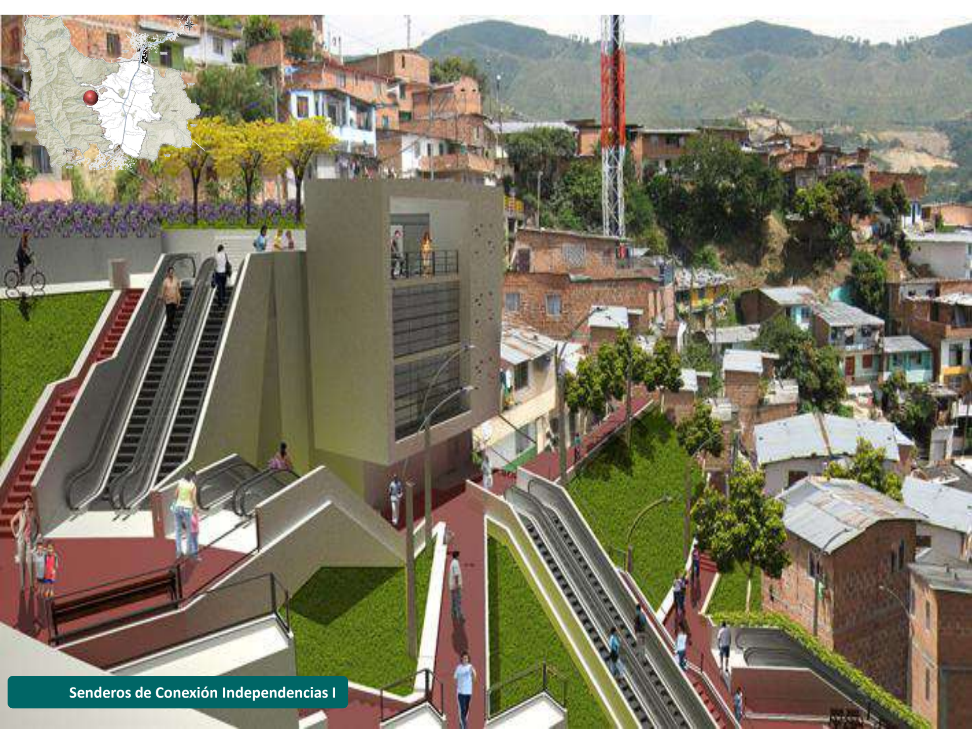
Senderos de Conexión Independencias I