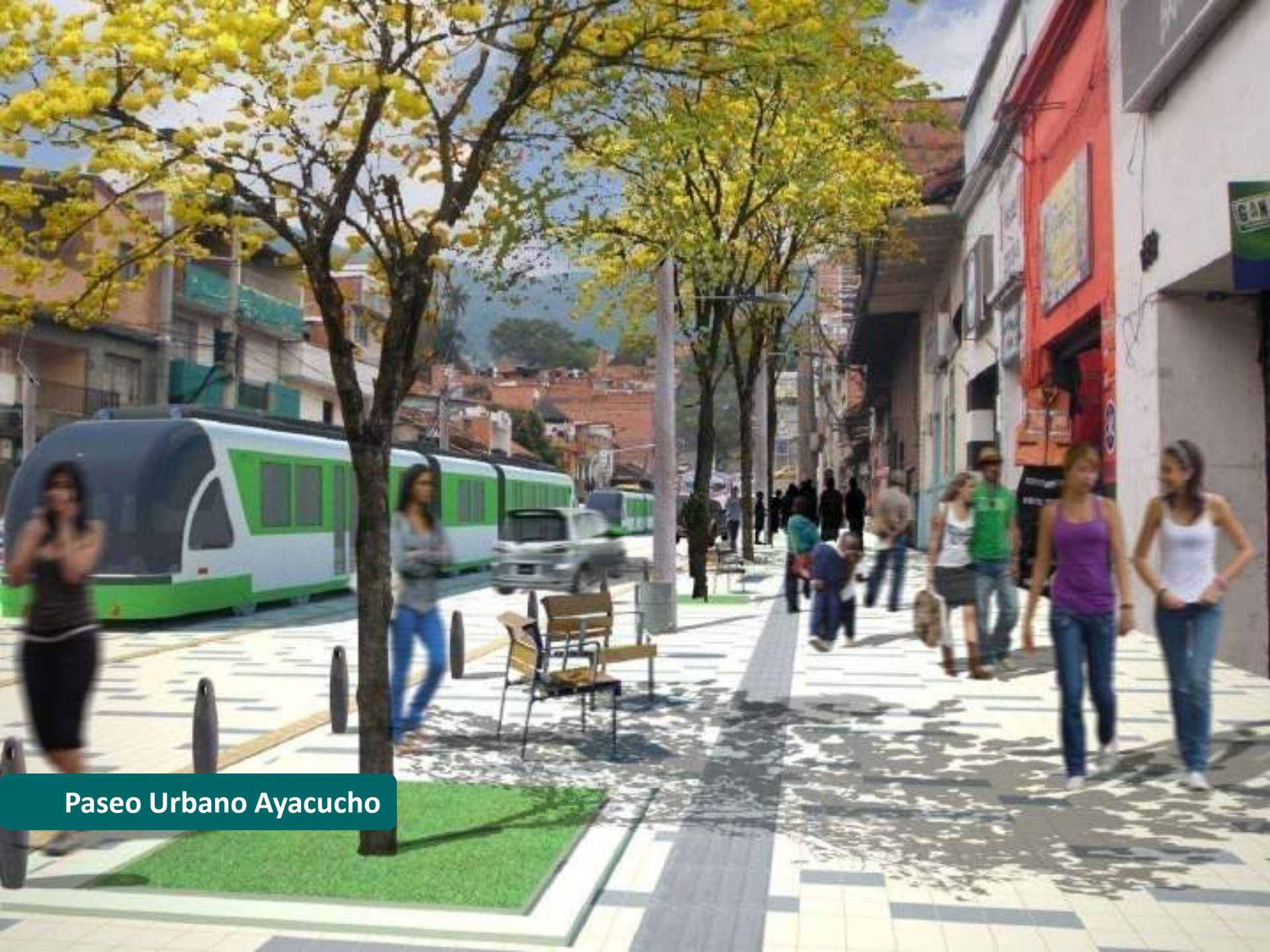
Paseo Urbano Ayacucho