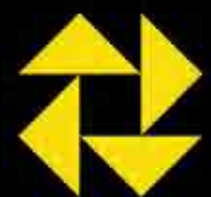
Memorial de la abolición de la esclavitud. Nantes (Francia), 2011.