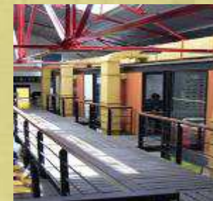
Distrito de Diseño