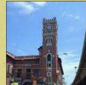
Distrito de las Artes