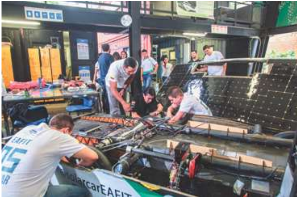
Uno de los proyectos de investigación e innovación educativa vinculado al uso de energía solar.

de ser asertivos en la elaboración de propuestas para su crecimiento. De ello se ocupa en forma permanente la Escuela de Humanidades con su Departamento de Gobierno y Ciencias Políticas.