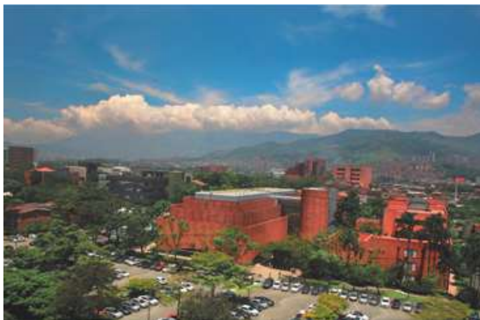
Vista general de la sede de EAFIT en Medellín.

Leer e interpretar de forma metódica y comprometida el contexto de la sociedad a la que se pertenece, con el propósito de articularse plenamente a sus procesos de creación y transformación, ha sido para la Universidad EAFIT, más que una estrategia de actuación administrativa, el principio fundante de su ser institucional, el educativo, en su triple función: formación, investigación y proyección social.