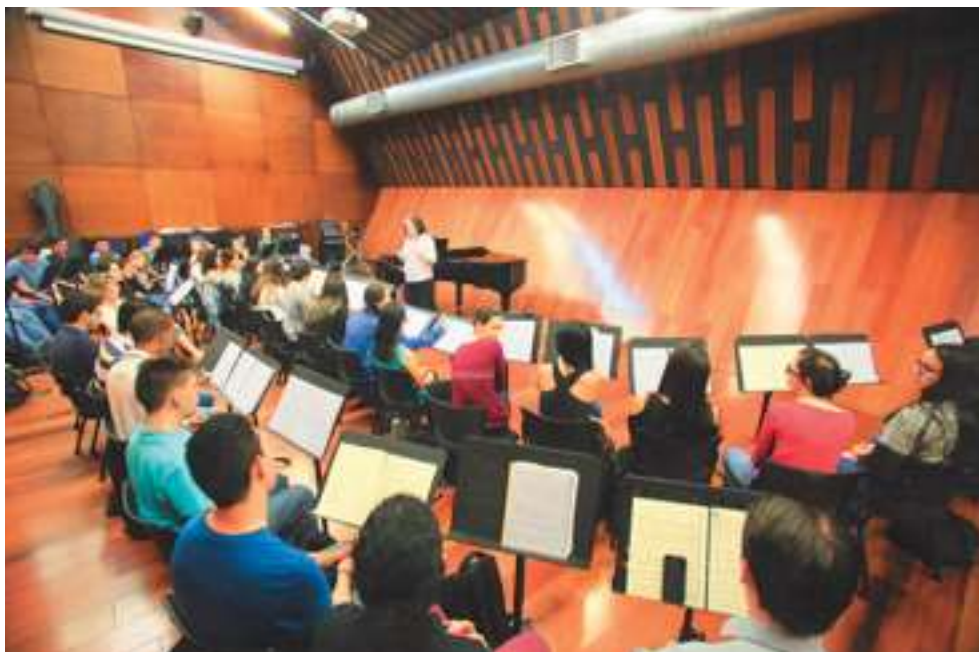
Sala multimedial de música.

misión desarrollar capacidades para integrar las tecnologías de la información y las comunicaciones, TIC, en los ambientes de aprendizaje, con el fin de mejorar la calidad de la educación por medio de proyectos de investigación, desarrollo e innovación que conviertan las aulas, las instituciones educativas y la ciudad misma, en laboratorios de aprendizaje, indagación, exploración y experimentación.