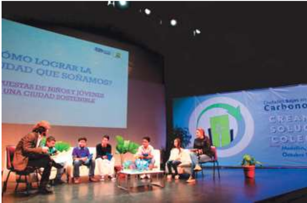
Cultura ambiental en el aula y la ciudad. Encuentro sobre Ciudades Bajas en Carbono (octubre 2016).

cual se hicieron recomendaciones útiles al sector privado para afianzar dicho escenario y asegurar las mejores decisiones para el país.