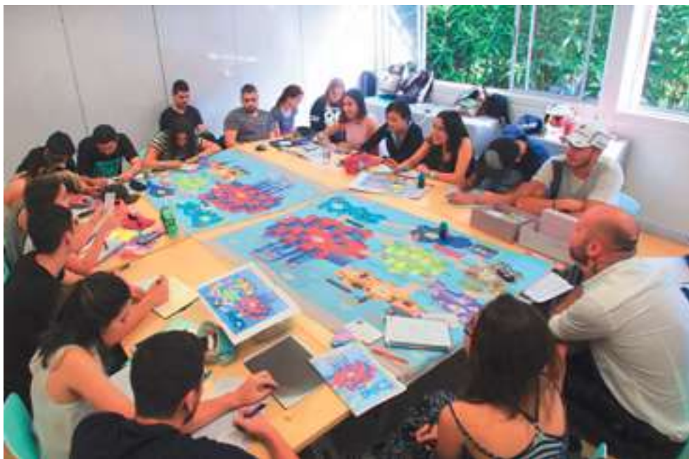
Una actividad formativa de Ingenierías basada en el trabajo práctico y colaborativo.

tural documental y la memoria histórica regional, así como la divulgación de la creación artística que contiene y expresa su identidad, son connaturales al ideario y a las prácticas cotidianas de la vida en el campus. Formar integralmente implica hacerlo en el contexto del diálogo y la complementación de fuentes educativas y culturales.