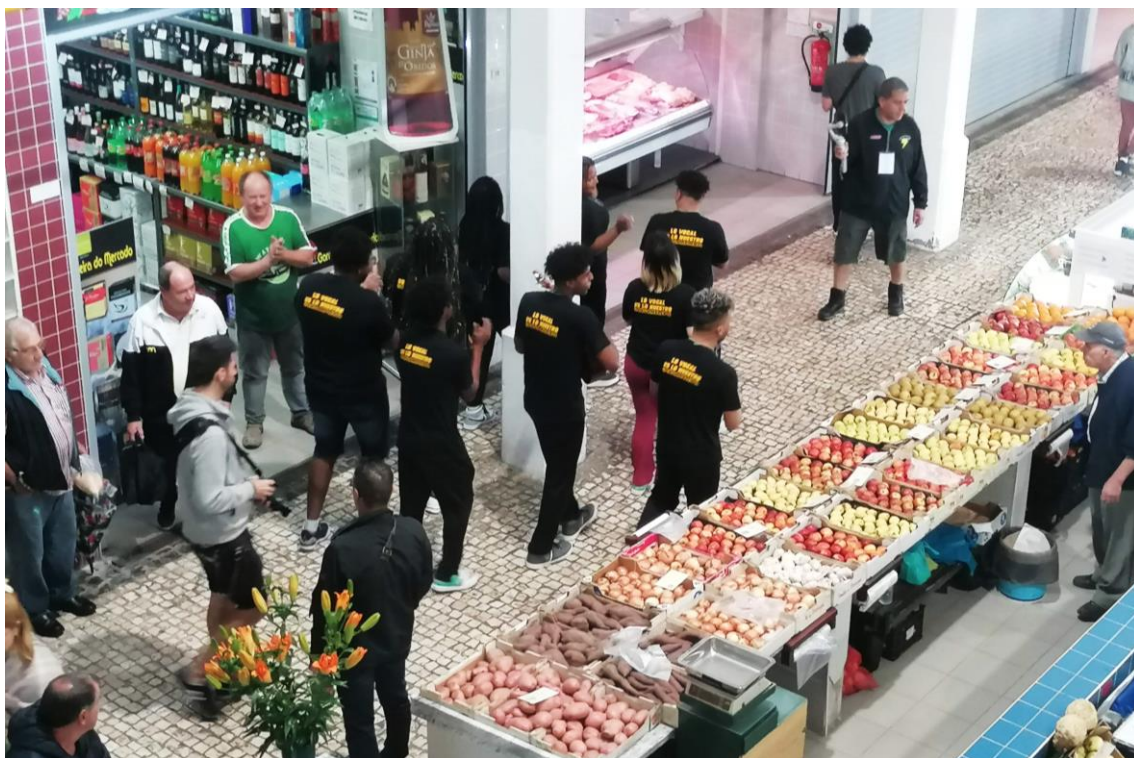
Actuación musical en el Mercado do Livramento durante las Jornadas.

En el panel, se destacó que es necesario sustituir el término “gasto” en cultura por inversión en cultura . También se señaló la importancia de los trabajos que se están desarrollando desde Ibercultura Viva para elaborar indicadores culturales sobre desarrollo económico, social y humano, puesto que son clave para la elaboración de cualquier política cultural y proceso de planificación estratégica en cultura.