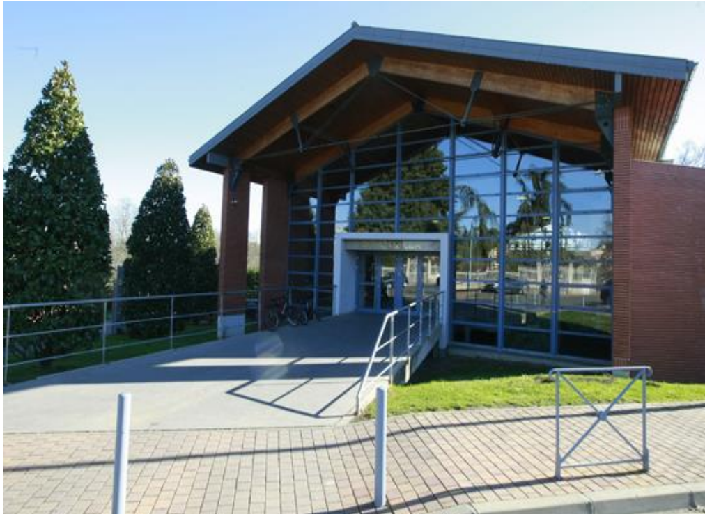
Mediateca - 1999