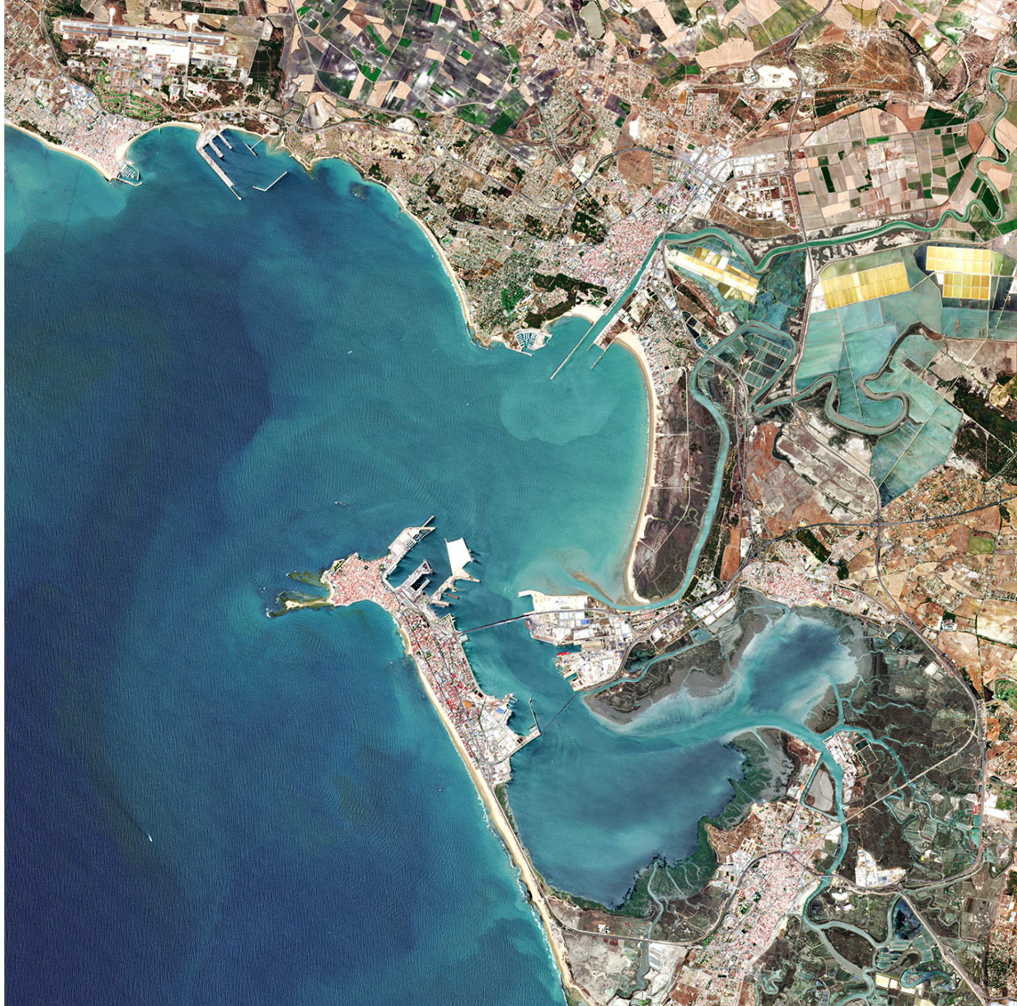
De European Space Agency - Seville, Spain, CC BY-SA 2.0,