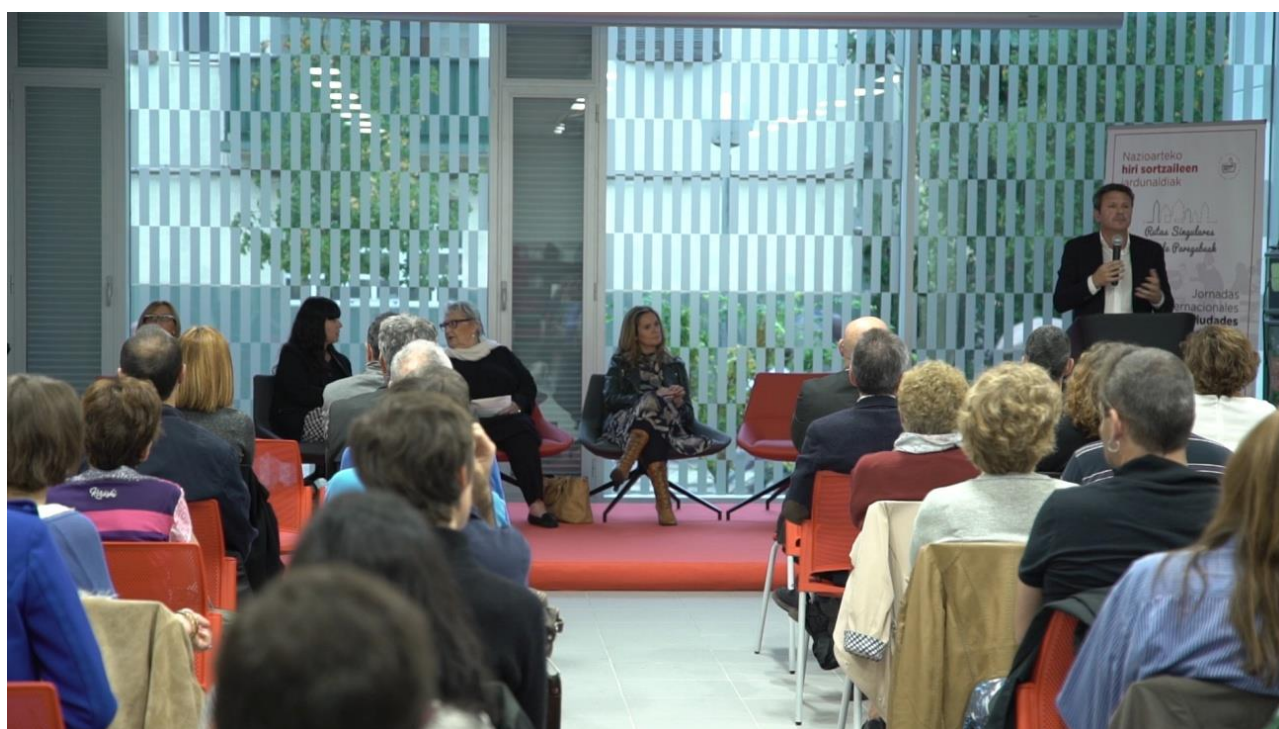
Presentación de las IX Jornadas Ciudades Creativas Kreanta – Rutas Singulares 2017 a cargo de José Antonio Santano, Alcalde de Irún.

La novena edición de las Jornadas Internacionales Ciudades Creativas organizada conjuntamente entre la Fundación Kreanta y el Ayuntamiento de Irún, se ha llevado a cabo en Irún del 18 al 20 de octubre de 2017 en el marco del proyecto europeo “Rutas Singulares”.